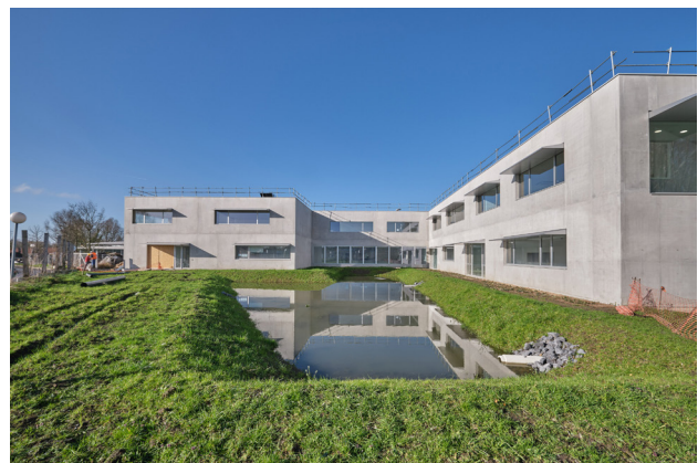
Campus Lesaffre à Marquette.